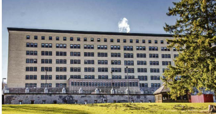
Tout porte à croire que la buanderie que l'on croyait fragilisée par une fermeture imminente fait maintenant l'objet d'étude de modernisation et de rentabilité.

Faut-il s'inquiéter de l'avenir de la buanderie de l'hôpital de Rivière-Rouge ?