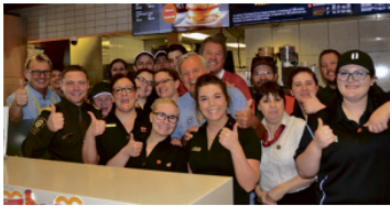
À Sainte-Agathe, le DG de la Fondation Daniel Desjardins et le légendaire défenseur des Canadiens Pierre Bouchard accompagnent les membres de l'équipe ainsi que les bénévoles et personnalités.