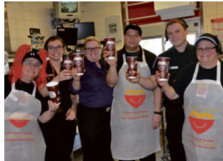
L'équipe du McDonald's de la Montée Ryan à Mont-Tremblant était fébrile à l'aube du Grand McDon.