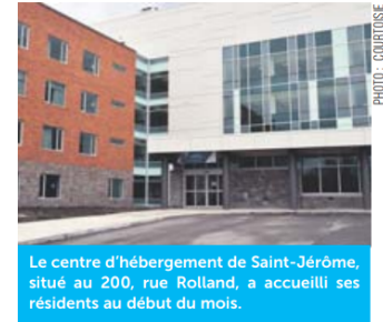
Le centre d'hébergement de Saint-Jérôme, situé au 200, rue Rolland, a accueilli ses résidents au début du mois.

« Je tiens à remercier toutes les personnes qui, de près ou de loin, ont contribué à la réalisation du projet et qui étaient présentes lors du déménagement pour accueillir chaleureusement les résidents. J'en profite pour souligner le travail exceptionnel du personnel qui se dévoue sans compter auprès de cette clientèle vulnérable et je