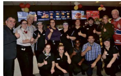
La bonne humeur régnait au restaurant McDonald's La Porte du Nord en présence du sympathique numéro 11 des Canadiens, Yvon Lambert.