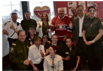
L'incroyable défenseur Guy Lapointe, membre du célèbre Big Three des Canadiens, était heureux de participer à l'événement au restaurant de Saint-Sauveur. Il est entouré de personnalités locales et de quelques membres de l'équipe.