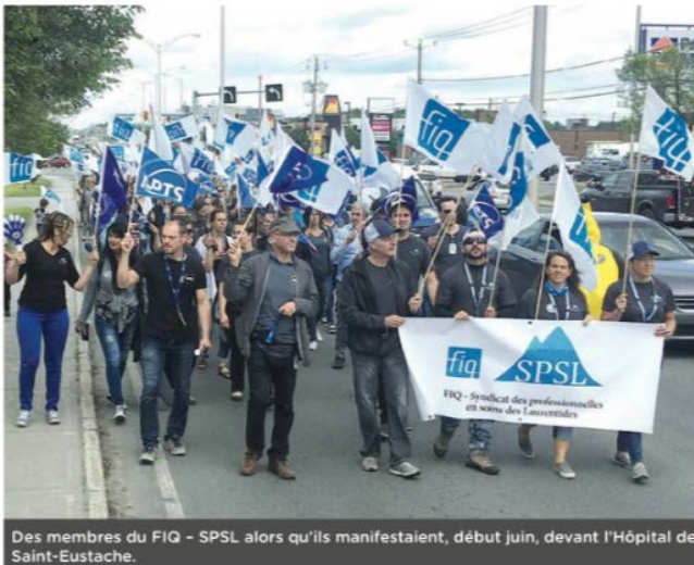
Des membres du FIQ - SPSL alors qu'ils manifestaient, début juin, devant l'Hôpital de Saint-Eustache.