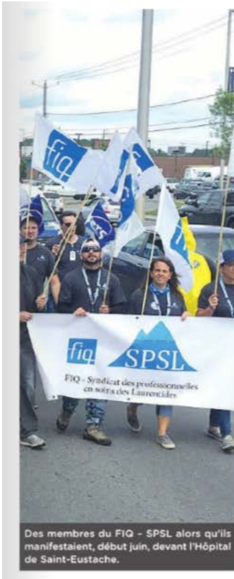
Des membres du FIQ-SPSL alors qu'ils manifestaient, début juin, devant l'Hôpital de Saint-Eustache.

«Il nous fera plaisir de procéder dès que l'entente sera ratifiée. Ceci devrait avoir lieu dans les prochains jours», a fait savoir par courriel, Thais Dubé, agente d'information pivot pour le Service des relations médias, relations publiques et à la communauté, du CISSS des Laurentides.