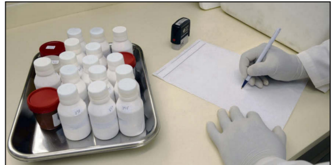
Le Syndicat des travailleuses et travailleurs des Laurentides en santé et services sociaux (STLSSS-CSN) et le CISSS des Laurentides n'ont pas la même lecture de la situation en ce qui concerne les besoins de main-d'œuvre et la sécurité des usagers.