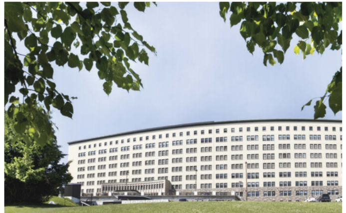
Après un peu plus de six mois, une entente est enfin survenue entre les membres du SPSL - FIQ et le CISSS des Laurentides.