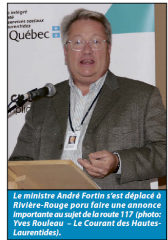
Le ministre André Fortin s'est déplacé à Rivière-Rouge pour faire une annonce importante au sujet de la route 117.