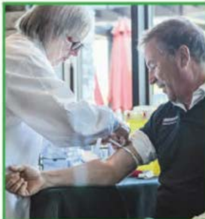
Les participants de la 26 e édition du Master de golf de la FHSQ ont reçu gracieusement un bilan de santé complet grâce à Charwell L'Urviqae.