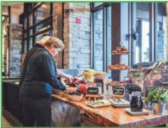
Les participants ont pu faire le plein d'énergie avant de débiter la journée de golf, grâce au copieux brunch gracieusement offert par Le Groupe Népveu.