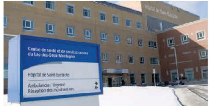
La salle d'accouchement de l'Hôpital de Saint-Eustache a été fermée le week-end dernier. Des femmes devaient être transférées vers d'autres établissements de santé de la grande région de Montréal.

«Ainsi, durant la dernière fin de semaine, six accouchements ont eu lieu à l'hôpital de Saint-Eustache et 11 ont été transférés dans d'autres centres hospitaliers, con-