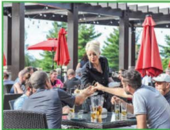
Pour terminer la journée en beauté, rien de mieux qu'un bon cocktail gracieusement offert par Trivium Avocats.