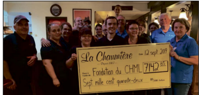
Remise du chèque au montant de 7 142,85$. Cette 13e édition de la levée de fonds organisée par la Chaumière pour la Fondation de l'hôpital a permis de dépasser la somme de 2018 de 700$.

Les préparatifs de la journée débutent la veille, mais l'organisation, pour sa part, prend quelques mois à se mettre en place. Si la journée est une réussite, c'est assurément