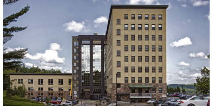
Il est possible que d'autres fermetures temporaires de services aux soins intensifs surviennent à Rivière-Rouge.

« Nous faisons tout en notre possible pour maintenir les services de soins intensifs à Rivière-Rouge, mais devons composer avec les contraintes associées à ce milieu », indique-t-on. ❖