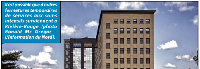
Il est possible que d'autres fermetures temporaires de services aux soins intensifs surviennent à Rivière-Rouge (photo Ronald Mc Gregor - L'Information du Nord).

Selon le service des communications et des relations publiques du Centre intégré de santé et de services sociaux (CISSS) des Laurentides,