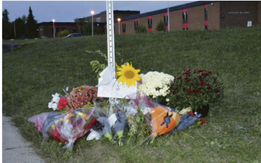
Dès le lendemain du drame, de nombreux témoignages de sympathie et des fleurs ont été déposés à l'intersection des rues Légaré et Brissette, où l'accident mortel a eu lieu.