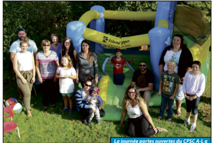
La journée portes ouvertes du CPSC A-L a été un moment d'échanges et surtout de plaisir (photo: Kathleen Godmer - Le Courant des Hautes-Laurentides).

Après un an d'opération dans ses locaux, le CPSC A-L peut tracer un bilan des plus positifs. Caroline Collin, impliquée depuis le tout début du projet