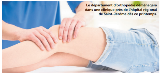
Le département d'orthopédie déménagera dans une clinique près de l'hôpital régional de Saint-Jérôme dès ce printemps.

régional de Saint-Jérôme. On sait qu'un projet d'agrandissement a été autorisé par le gouvernement Legault qui est présentement à l'étape de la planification, il n'y aura pas de nouveaux espaces disponibles avant plusieurs années au sein de l'établissement.