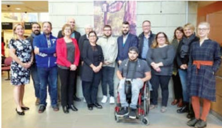
Ce sont les huit représentants de la délégation du Luxembourg entourés des représentants du CISSS des Laurentides et de la représentante du conseil québécois d'agrément.

Le CISSS des Laurentides a reçu, au mois d'octobre dernier, une délégation en provenance du Luxembourg venue explorer ses pratiques en partenariat de soins et de services avec les usagers, ainsi que ses services en déficience intellectuelle, trouble du spectre de l'autisme et déficience physique.