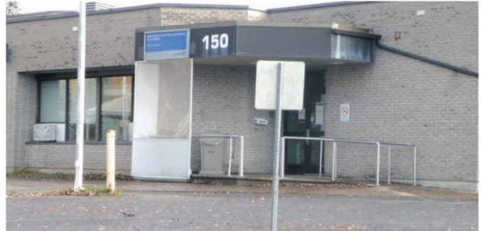
La présence de punaises de lit dans un centre hospitalier, comme ce qui a été vu à Lachute, serait une première dans tout le CISSS des Laurentides.

Celle-ci a reçu la visite d'un exterminateur. « Toutes les mesures sont prises auprès de la clientèle et des employés pour assurer la sécurité de tout un chacun, de même que des lieux. La quarantaine sera levée lorsqu'il n'y aura plus de risque de propagation », a assuré l'équipe de communication du CISSS des Laurentides.