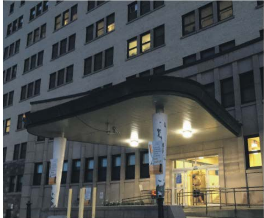
La cafétéria du centre hospitalier de Rivière-Rouge connaît aussi des fermetures en soirée par manque de personnel.