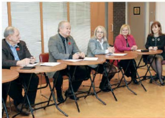
Les maires et mairesses des sept villes de la MRC ont signé l'entente de collaboration en lien avec l'insalubrité morbide. Les services de police, d'incendie, et bien sûr le CISSS sont impliqués.

Cette entente vient donc répondre à un besoin des villes et des différen-