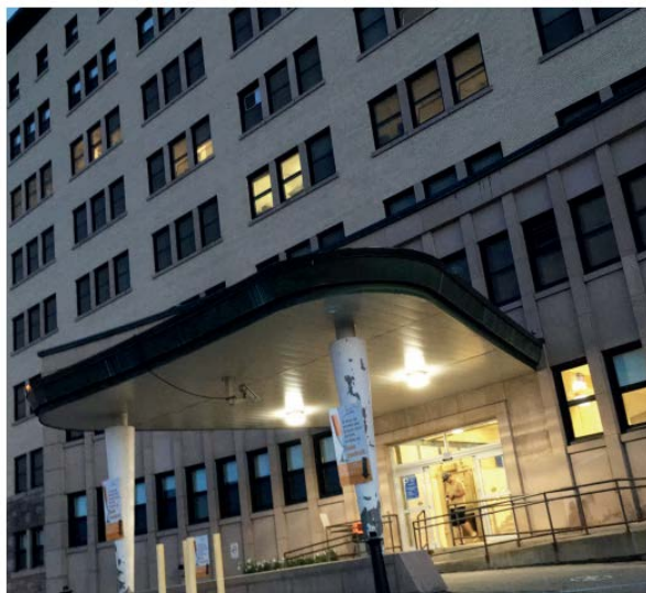
La cafétéria du centre hospitalier de Rivière-Rouge connaît aussi des fermetures en soirée par manque de personnel.