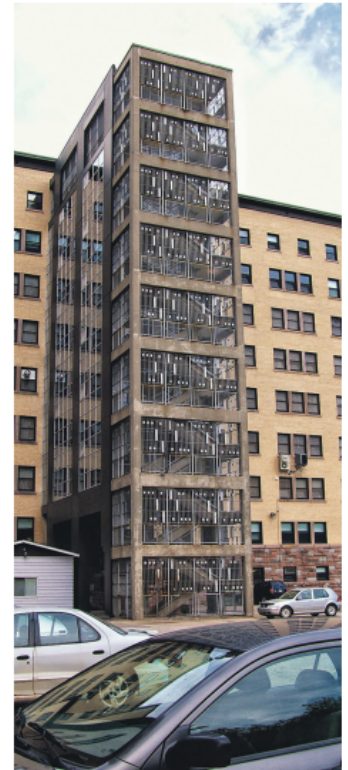
La situation du service en soirée de la cafétéria du point de services de Rivière-Rouge relève du manque d'effectifs, une situation qui doit se résorber selon la direction générale du CISSS des Laurentides.

Le CISSS des Laurentides se dit proactif dans son activité de recrutement « favorisant un processus d'embauche en continu » selon Mme Laroche. « À cet effet, plusieurs candidats sont attendus