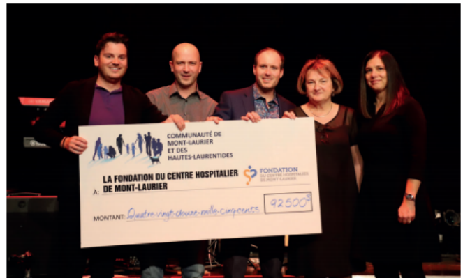
La FCHML a égalé le montant amassé l'an dernier alors qu'elle avait mis le paquet pour célébrer son 30 e anniversaire.

La Clinique Jeunesse du CLSC a reçu une table d'examen avec dossier électrique (5 500 $); le Bloc opératoire a été doté de quatre hystérocopes pour examen de l'utérus (22 000 $); le département de périnatalité a un bilirubinomètre (8 500 $) pour mieux suivre les bébés qui sont atteints de la jaunisse du bébé. Le département d'obstétrique a reçu un moniteur fœtal (23 000 $) afin de