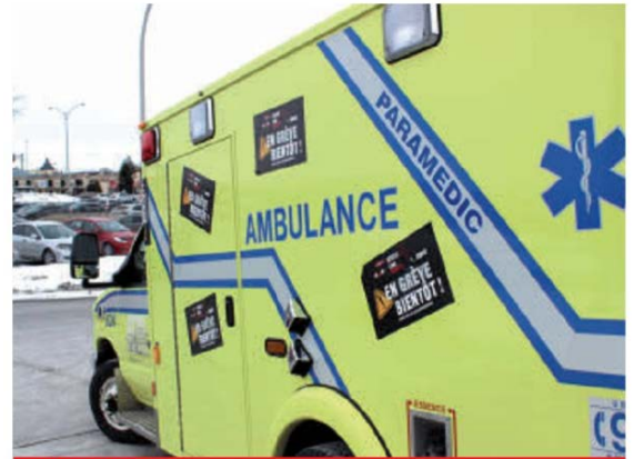
S'il vous est possible d'éviter les urgences, faites-le.

Christian Asselin c.asselin@groupejcl.ca