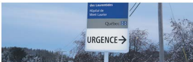
Depuis les derniers jours, la situation à l'hôpital de Mont-Laurier n'est pas des plus faciles dû au taux d'occupation à l'urgence qui atteint des pourcentages très élevés et qui ne cesse de varier.

À ces quelques initiatives s'ajoute aussi la signature de deux ententes uniques au Québec avec le Syndicat des professionnelles en soins des Laurentides, affilié à la Fédération interprofessionnelle de la santé du Québec : l'entente de rehaussement des postes à temps partiel et l'entente de postes à la carte pour les postes à temps partiel et poste d'embauche. 🗳️