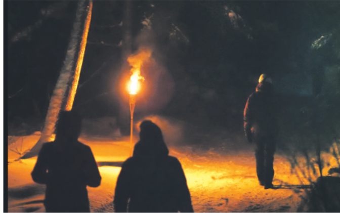
La randonnée sous les étoiles se déroulera le 25 janvier au Domaine Saint-Bernard à Mont-Tremblant et le 1 er février au Camping et centre de plein air Sainte-Agathe.