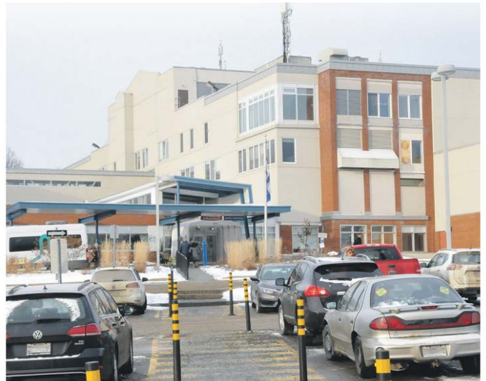
L'urgence de l'Hôpital Laurentien a atteint un taux d'occupation de 211% le 3 janvier. Depuis, ce taux diminue lentement.

La population est aussi invitée à vérifier préalablement la disponibilité de leur médecin de famille ou alors de s'adresser à une clinique sans rendez-vous pour obtenir une consultation médicale. Enfin, les pharmaciens sont aussi en mesure de donner des conseils pour soulager les symptômes des virus particulièrement actifs en période hivernale, tels ceux de la grippe et de la gastro-entérite. 7