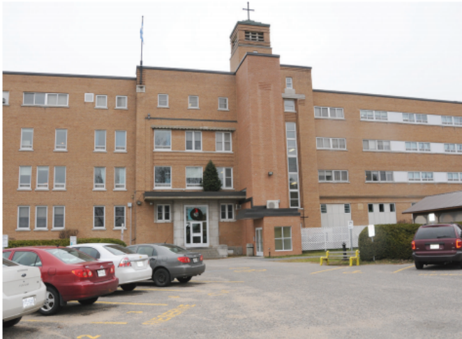
Dès janvier 2019, les responsables du Centre jeunesse d'Huberdeau ont mis en vigueur de nouvelles règles concernant les mesures d'encadrement afin de limiter le nombre de fugues.

Dans son rapport, la Sûreté du Québec indiquait qu'aucun élément criminel n'avait été détecté en rapport au décès et aucune lettre de suicide n'avait été trouvée. Les policiers concluaient à une fugue au cours de laquelle la noyade est survenue. 16