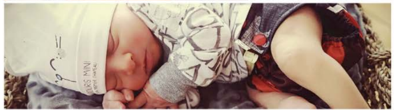
À peine 12h après la naissance, maman se disait en pleine forme, malgré les quelques points qu'on avait dû lui faire. Tout le monde allait très bien même si la fatigue se faisait sentir et déjà la petite famille en était à s'apprivoiser doucement.