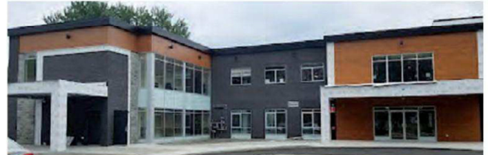
La Résidence Au Coeur de la Vie de St-Antoine se retrouve en «zone critique», mais avec un total de trois cas.

Ainsi, on dénote à nouveau la présence du Manoir Joie de vivre de Sainte-Thérèse en