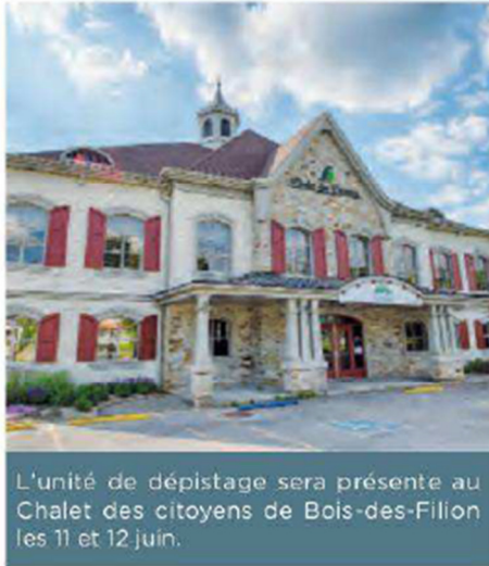
L'unité de dépistage sera présente au Chalet des citoyens de Bois-des-Filion les 11 et 12 juin.