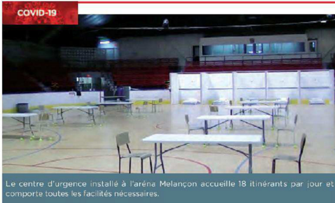
Le centre d'urgence installé à l'aréna Melançon accueille 18 itinérants par jour et comporte toutes les facilités nécessaires.

MYCHEL LAPOINTE mychel.lapointe@infoslaurentides.com