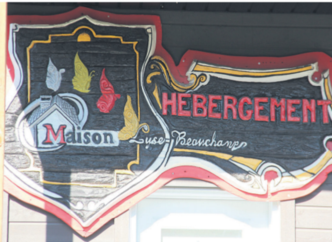
À cause de besoins grandissants dans la région, la Maison Lyse-Beauchamp vient d'ouvrir une deuxième ressource intermédiaire en santé mentale au centre-ville de Mont-Laurier.