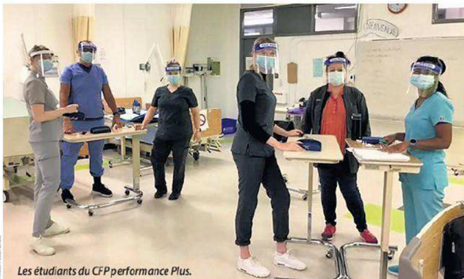
Les étudiants du CFP performance Plus.

Marie-Catherine Goudreau - Moins d'une semaine après la mise en ligne de la plateforme d'inscriptions pour la formation accélérée de préposés aux bénéficiaires en CHSLD, déjà 90 000 personnes avaient démontré leur intérêt.