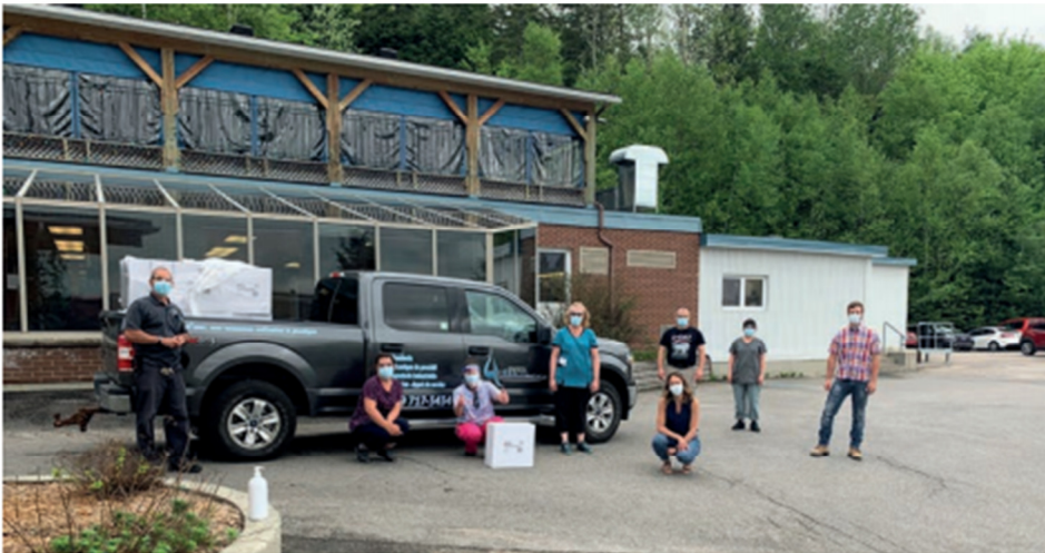
Des employés de la Plomberie St-Jovite remettent des ventilateurs au CHSLD de Labelle.