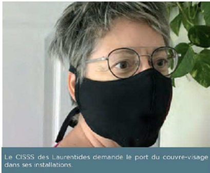
Le CISSS des Laurentides demande le port du couvre-visage dans ses installations.