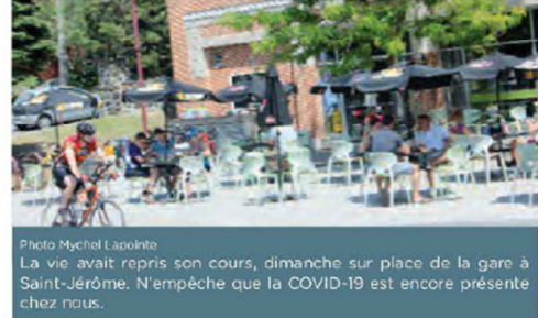
La vie avait repris son cours, dimanche sur place de la gare à Saint-Jérôme. N'empêche que la COVID-19 est encore présente chez nous.

MYCHEL LAPOINTE mychel.lapointe@infoslaurentides.com