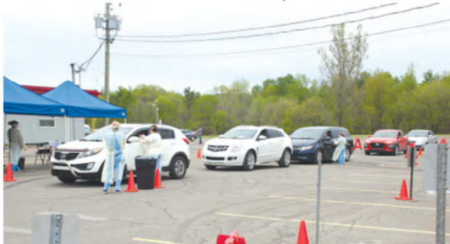
Le CISSS des Laurentides a indiqué être très satisfaite de la participation des citoyens à sa clinique de dépistage mobile tenue à la fin du mois de mai.

On note depuis quelques semaines une diminution du nombre de nouveaux cas actifs de la COVID-19 partout sur le territoire laurentien.