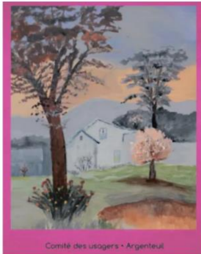
Comité des usagers • Argenteuil