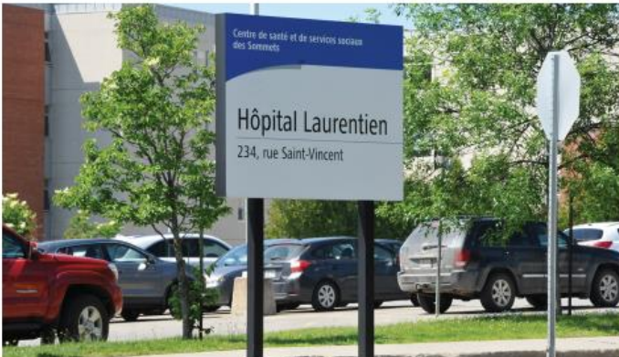
L'hôpital Laurentien de Ste-Agathe pourrait réserver une partie de ses installations pour recevoir des patients atteints de la COVID-19, si leur nombre augmente encore dans les Laurentides.

d'hospitalisation pour les personnes infectées à la COVID-19 nous permettra de transférer les patients vers différents hôpitaux, ce qui facilitera la dispensation de nos soins et services. Cela aura sans aucun doute des effets bénéfiques pour les usagers, mais aussi auprès de notre personnel qui pourra s'épauler encore plus dans le contexte actuel », a-t-elle expliqué. ●