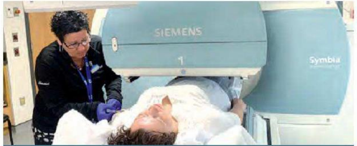
Les techniciennes en imagerie médicale veulent être traitées comme leurs consœurs.