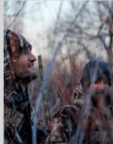
Les chasseurs peuvent pratiquer leur loisir, mais doivent respecter les règles sanitaires.

Enfin, les autorités sanitaires incitent les chasseurs à enregistrer leurs gibiers en ligne plutôt qu'en personne au mffp.gouv.qc.ca afin de limiter les contacts physiques.