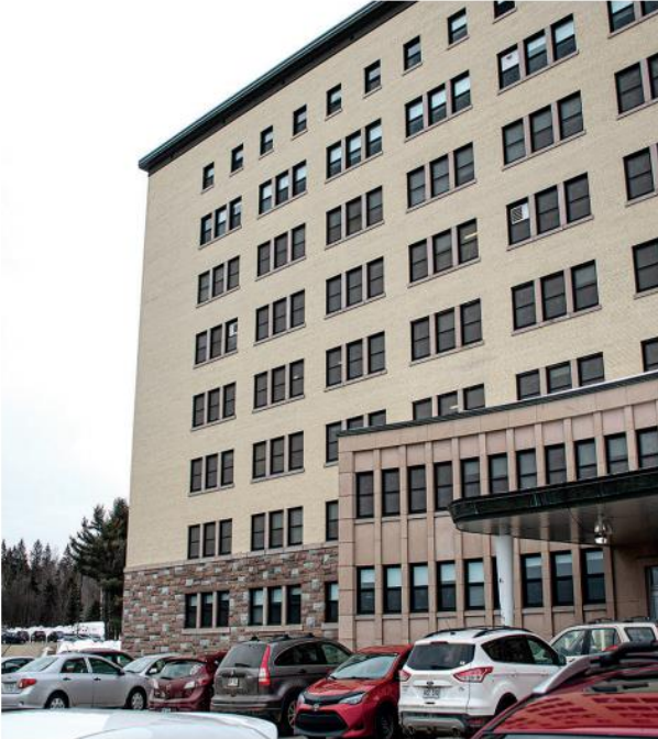
Les deux lits des soins intensifs à l'unité de médecine de l'hôpital de Rivière-Rouge sont encore une fois fermés pour une durée indéterminée.