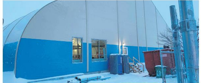
280 patients ont contracté la COVID-19 et 83 décès sont liés aux infections nosocomiales de COVID-19 depuis le début de la pandémie à l'Hôpital régional de Saint-Jérôme où un bâtiment temporaire de 57 lits supplémentaires est en construction.

Présentement, 7 employés sont en absence pour cause de symptômes ou de tests positifs à la COVID-19 et 4 usagers sont positifs à la COVID, et ce, répartis dans les 2 unités touchées par l'éclosion, indiquent les plus récentes données