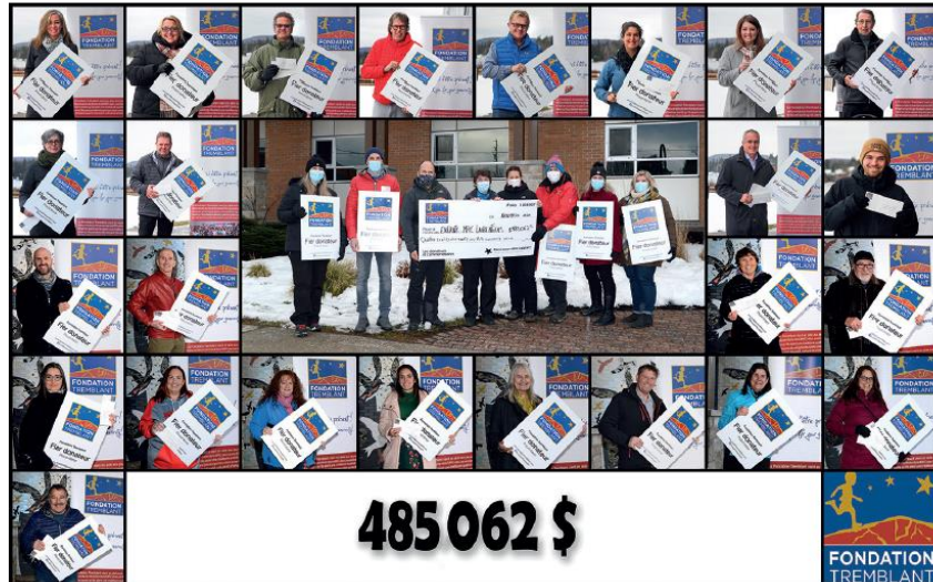
De nombreux représentants d'organismes bénéficiaires des dons de la Fondation Tremblant ont reçu des chèques les 27 et 28 novembre pour mener à bien leur mission.

Même si le traditionnel encan de Pâques s'est déroulé cette année de façon virtuelle, la Fondation est néanmoins parvenue à soulager la détresse financière de plusieurs organismes de chez nous, en remettant des dons d'avance, en avril et en septembre, en plus de ceux qui ont été distribués en marge du 24h de Tremblant. Étant donné les règles de santé publique en vigueur, les remises de chèques se sont déroulées une semaine avant l'événement et en-dehors de la montagne.