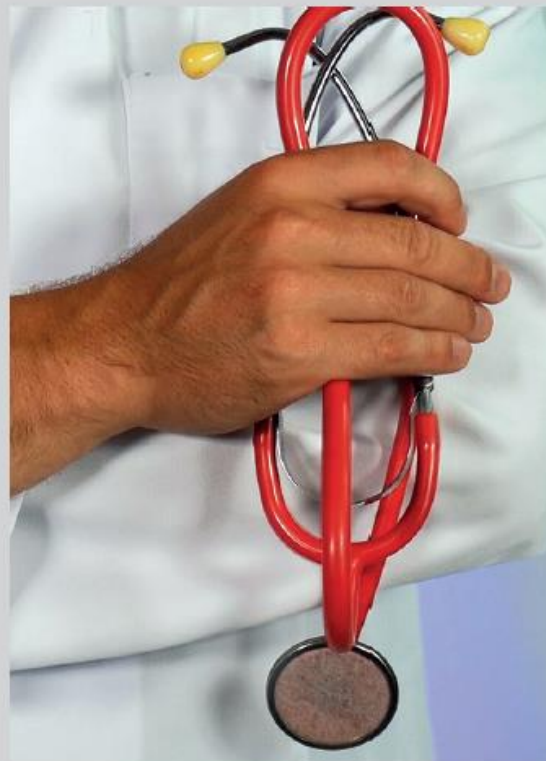
41 nouveaux médecins de famille arrivent dans les Laurentides.