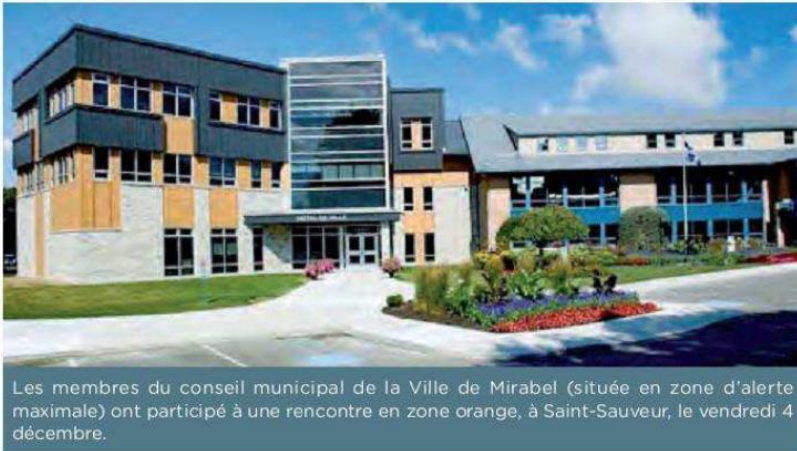
Les membres du conseil municipal de la Ville de Mirabel (située en zone d'alerte maximale) ont participé à une rencontre en zone orange, à Saint-Sauveur, le vendredi 4 décembre.

Nicolas T. Parent Initiative de journalisme local | Canada