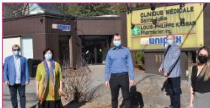
Nouveaux services à la Clinique médicale de Sainte-Adèle