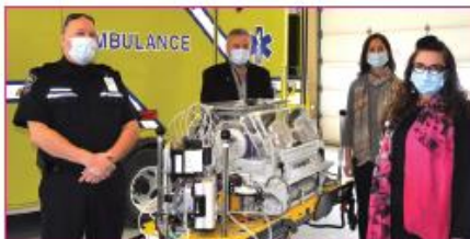
Transport néonatal pour les nouveau-nés