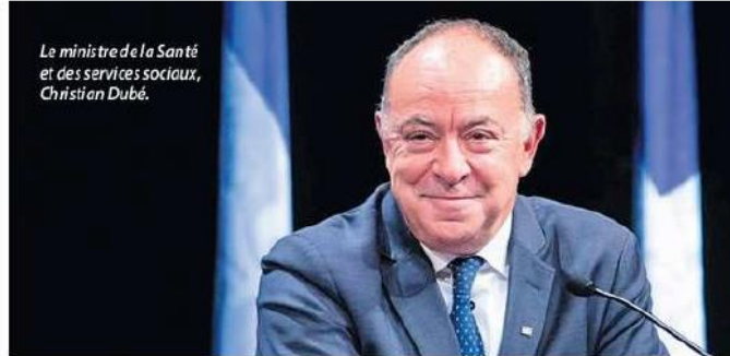
Le ministre de la Santé et des services sociaux, Christian Dubé.

La preuve vaccinale par QR (code barre) sera proposée aux Québécois. « Les gens qui ont reçu une première dose recevront graduellement un courriel pour savoir s'ils veulent la preuve électronique de vaccination. Faut savoir que la preuve papier sera remise quand même, mais certaines personnes vont vouloir avoir la preuve digitale qui est plus pratique que le papier », ajoute le ministre.