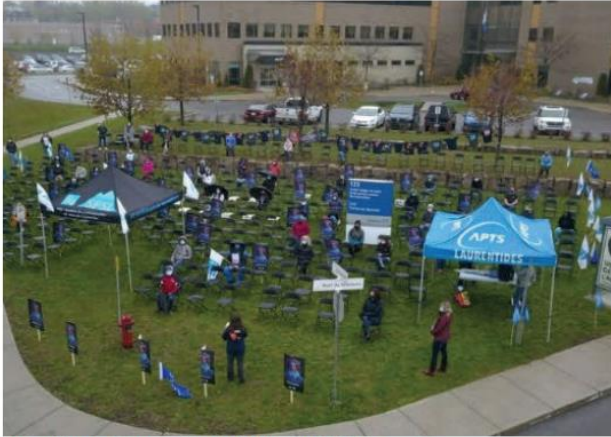
Rassemblement des membres de l'alliance APTS-FIQ - photo courtoisie

PATRICK BEAUSEJOUR patrick.beausejour@eap.on.ca