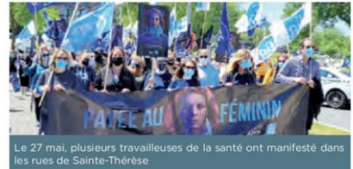
Le 27 mai, plusieurs travailleuses de la santé ont manifesté dans les rues de Sainte-Thérèse

(C. A.) — Représentant à eux deux quelque 8100 membres dans les Laurentides, les syndicats de la FIQ-SPSL (Syndicat des Professionnelles en soins des Laurentides) et de l'APTS (Alliance du personnel professionnel et technique de la santé et des services sociaux) ont manifesté conjointement à Sainte-Thérèse le 27 mai, devant les bureaux du ministre des Finances, Éric Girard. Leurs demandes salariales qui demeurent sans réponses sont au cœur de leur mécontentement.