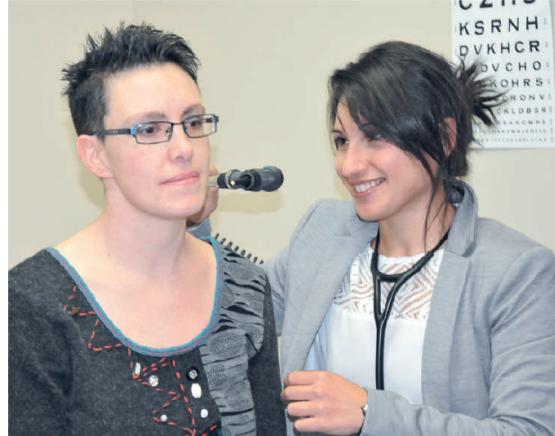
Les Laurentides sont la 4 e région la plus peuplée au Québec mais demeurent sous-financées par la province en ce qui concerne les soins de santé.

Rappelons que la Coalition Santé Laurentides veut que le gouvernement s'engage en faveur d'un rattrapage financier, respecte les échéanciers prévus pour livrer le projet d'agrandissement et de modernisation de l'Hôpital régional de Saint-Jérôme et une vision d'ensemble en accélérant le développement des projets de modernisation des autres centres hospitaliers qui en ont grandement besoin (Saint-Eustache, Sainte-Agathe, Mont-Laurier, Lachute et Rivière-Rouge). ●