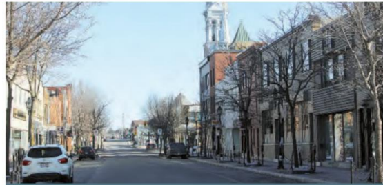
Les activités reprennent dans le centre-ville de Saint-Jérôme. Il faut, par contre, demeurer prudents.

D'un autre côté, la MRC Thérèse-de-Blainville demeure au premier rang avec 73 cas actifs (beaucoup mieux que le total de 101 de la semaine précédente), nettement devant les 37 de la MRC de la Rivière-du-