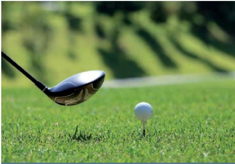
Le Master de golf de la Fondation Hôpital Saint-Eustache en sera à une 27 e édition.