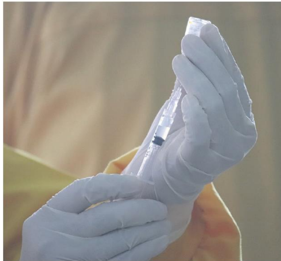
En date du 28 juin, 572 591 personnes ont été vaccinées dans les Laurentides.

Malgré les nouvelles encourageantes, le CISSSLAU n'écarte pas la possibilité de devoir faire face à une quatrième vague cet automne. De plus, le CISSSLAU a identifié un cas suspect de variant Delta dans les Laurentides. Bien qu'il n'y ait aucune éclosion majeure reliée à ce cas, ce variant demeure préoccupant. « Actuellement,