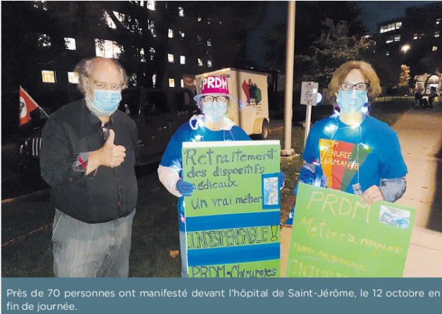
Près de 70 personnes ont manifesté devant l'hôpital de Saint-Jérôme, le 12 octobre en fin de journée.