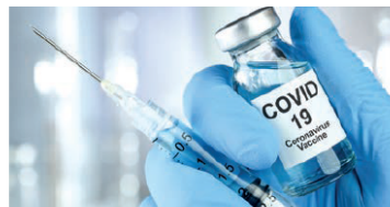
Selon le MSSS, le taux de vaccination des travailleurs de la santé et des services sociaux atteignait les 96% à la mi-octobre.

LES EXIGENCES ENVERS LES EMPLOYÉS DU RÉSEAU