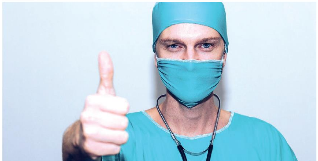
Pendant que la quatrième vague se poursuit, du côté du CISSSLAU, les nouvelles sont bonnes: baisse des cas actifs depuis cinq semaines consécutives, stabilité dans les éclosions, taux de vaccination en augmentation.

Au niveau des hospitalisations des cas actifs,