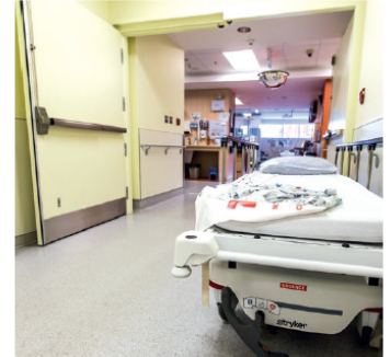
Le CISSSLAU fait partie des 17 structures en santé du Grand Montréal qui s'engagent à cesser de recourir au secteur privé pour combler la pénurie de main-d'œuvre dans leurs hôpitaux et autres centres de soins.

Par ces engagements clairs, le CISSSLAU a pour objectif de ramener au bercail les employés ayant quitté le réseau public pour le secteur privé dans les dernières années. Reste à voir si les actions posées seront en accord avec ces engagements dans les prochains mois. 📌