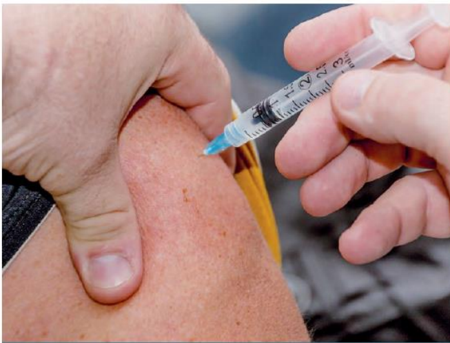
Amorcée il y a quelques mois, la campagne de vaccination progresse bien dans les Laurentides.