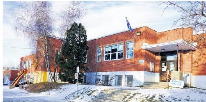
Le pavillon de La Vallée est fermé depuis mardi matin.

Selon le directeur général, c'est une bonne décision de la Santé publique « dans les circonstances ». « À partir du moment où il y a un certain nombre d'élèves touchés, c'est beaucoup plus facile pour nous d'offrir des services de qualité à distance », explique-t-il.