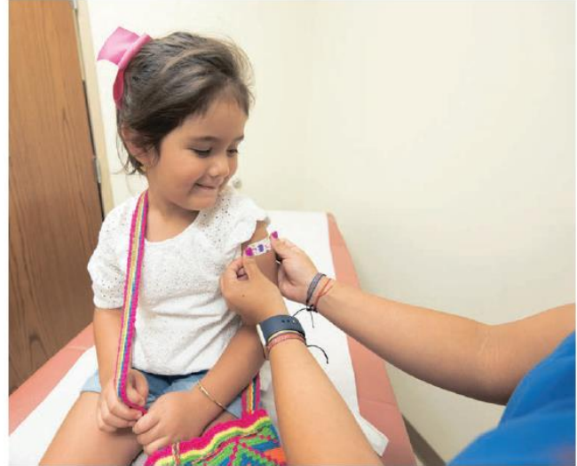
La campagne de vaccination pour les enfants débutera la semaine prochaine dans Argenteuil.

En milieu scolaire, la campagne devrait commencer dans Argenteuil dès la semaine prochaine. Au ministère de la Santé et des