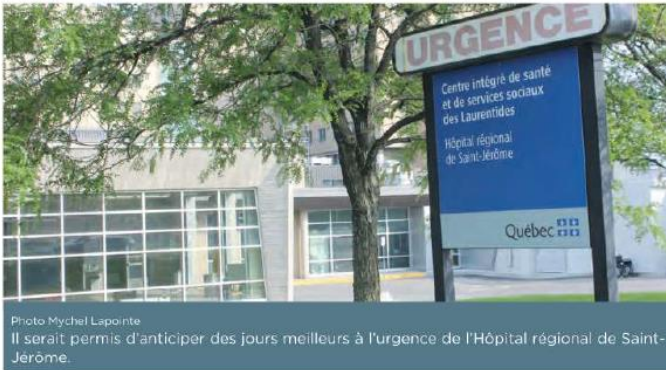
Photo Mychel Lapointe Il serait permis d'anticiper des jours meilleurs à l'urgence de l'Hôpital régional de Saint-Jérôme.

MYCHEL LAPOINTE Mychel.lapointe@infoslaurentides.com