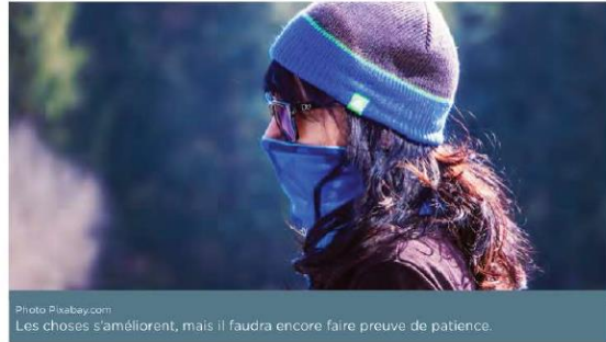
Les choses s'améliorent, mais il faudra encore faire preuve de patience.