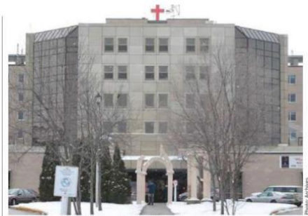
L'Hôpital régional de Saint-Jérôme.

Dans les milieux hospitaliers, on compte 12 éclosions actives, dont 5 qui devraient se terminer au courant de la semaine.