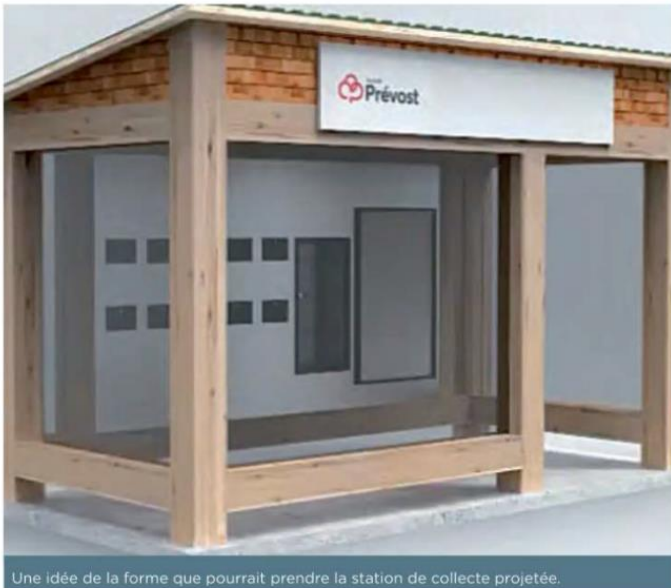
Une idée de la forme que pourrait prendre la station de collecte projetée.