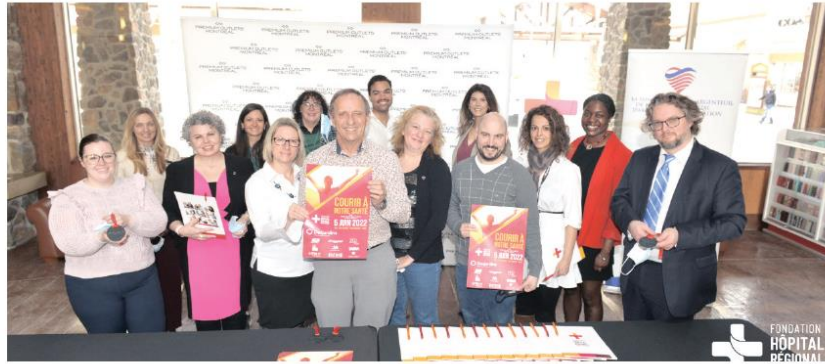
Les organisateurs et bénévoles sont très heureux du retour de Courir à notre santé en présentiel.

Contrairement à la caméra régulière, cette nouvelle technologie effectuera des examens plus précis, plus rapides et moins intrusifs pour le patient. Cet équipement permettra, entre autres, de détecter des cancers, des anomalies cardiaques ainsi que d'autres problèmes reliés aux tissus sur les organes avec une efficacité additionnelle de 25 % à 30 %.