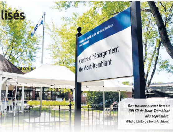
Des travaux auront lieu au CHLSD de Mont-Tremblant dès septembre.

« On aurait tenté de trouver des solutions. Ils nous mettent à la dernière minute, car