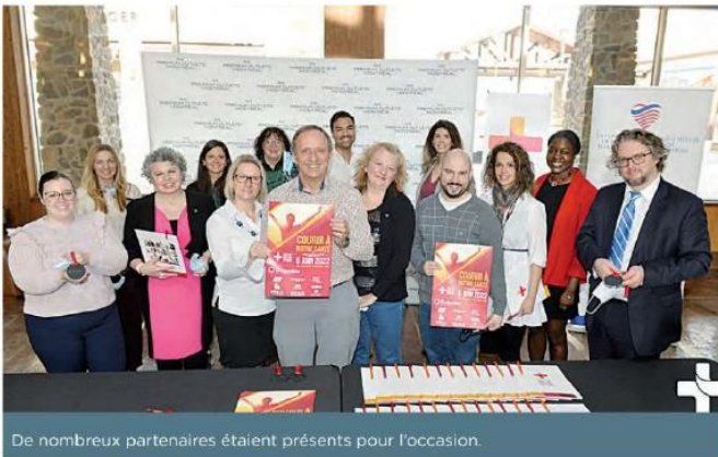
De nombreux partenaires étaient présents pour l'occasion.

STÉPHANIE PRÉVOST redaction@infoslaurentides.com