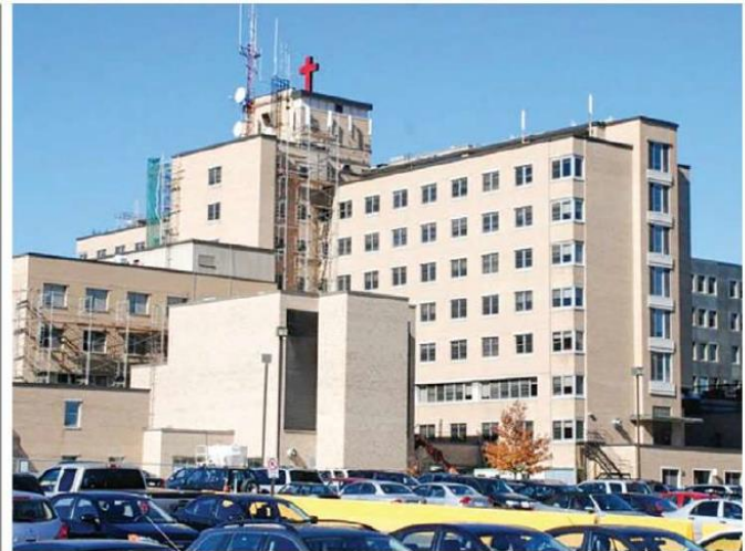
Hôpital régional de Saint-Jérôme.

La région des Laurentides a porté, depuis fort longtemps, des revendications légitimes