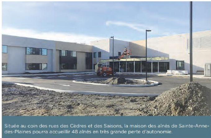
Située au coin des rues des Cèdres et des Saisons, la maison des aînés de Sainte-Anne-des-Plaines pourra accueillir 48 aînés en très grande perte d'autonomie.