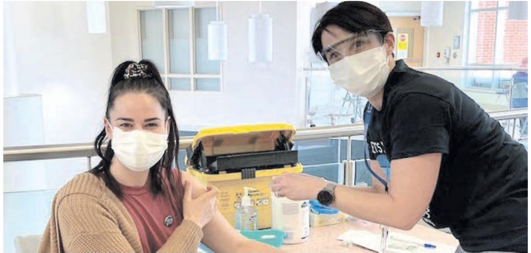
Depuis le 5 octobre dernier, la campagne de vaccination contre la grippe saisonnière s'est amorcée dans la région des Laurentides. La vaccination est la meilleure protection contre les complications de la grippe.

Plusieurs pharmacies de la région offrent également la vaccination contre la grippe. La prise de rendez-vous est sur clicsante.ca ou encore en contactant directement la pharmacie pour plus d'informations. Dans le but de rendre l'accès à la vaccination possible pour tous, le Centre intégré de santé et de services sociaux (CISSS) des Laurentides offre un service de navette