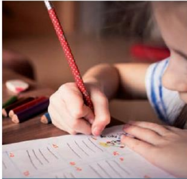
La Fondation du Centre jeunesse des Laurentides pallie aux besoins des jeunes de la région qui sont suivis en protection de la jeunesse.

Pour avoir davantage d'impacts sur la qualité de vie de ces jeunes, la Fondation du Centre jeunesse des Laurentides s'est jointe au regroupement de fondations pour la protection de la jeunesse du Québec qui a vu le jour la semaine dernière.