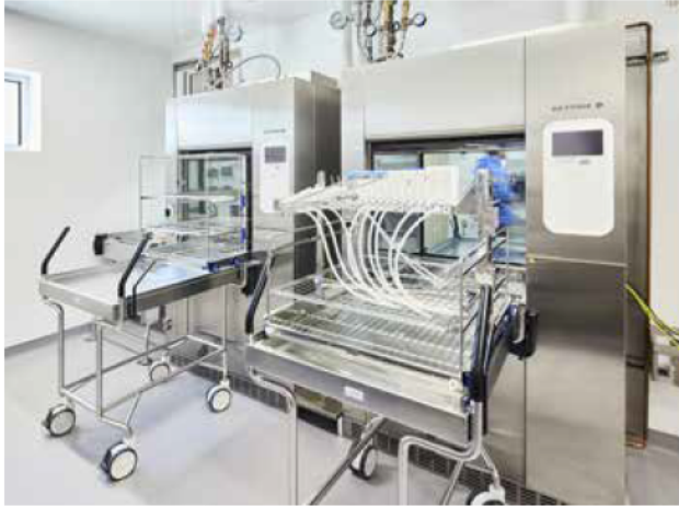
▲ The project consisted of designing sterilization equipment to increase the capacity of hospitals that lack space for this component or to use during renovation work.

During the design of the MMDRU, local expertise and suppliers were retained, resulting in the injection of more than $1.6 million into the provincial economy.