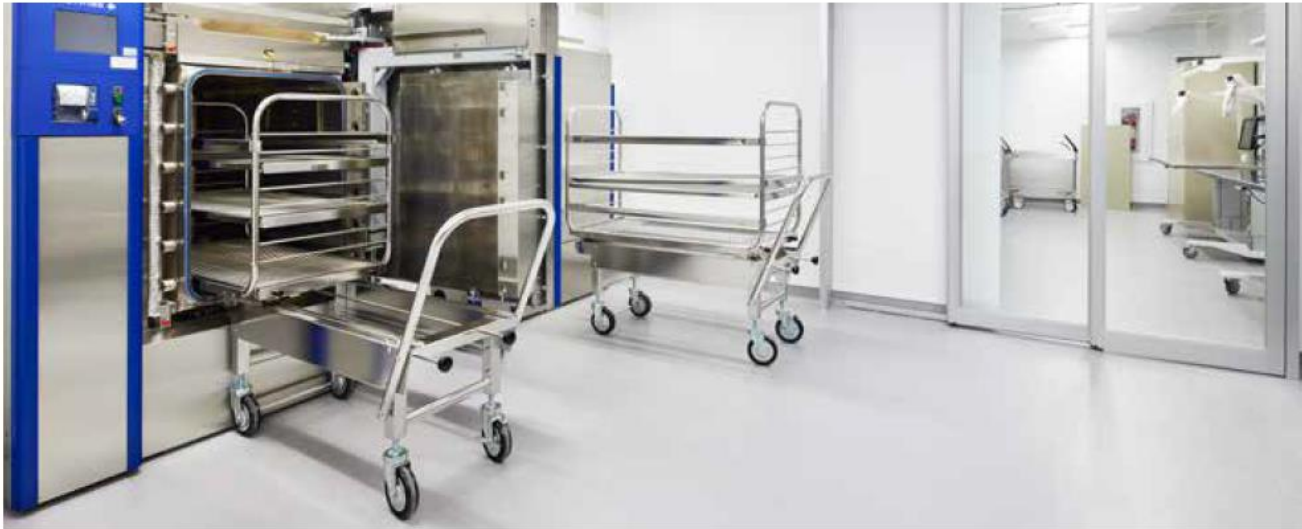
▲ A sterilization unit is a critical resource in a hospital, as it is essential for operating rooms. If the unit is not functional, the emergency department has to be closed.

current quality and pressure standards. Additionally, humidity levels within the unit needed to be maintained below 60 per cent at all times. Above that level, medical devices may need to be re-sterilized. As most medical appliances generate a significant amount of steam, a ventilation unit had to be installed to provide a high dehumidification and air conditioning load.