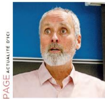
LE DÉPUTÉ DE QS, VINCENT MARISSAL ABASOURDI PAR LA DÉGRADATION DE L'HÔPITAL DE SAINT-JÉRÔME