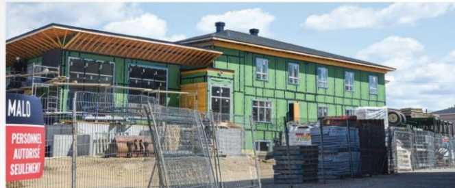
Les travaux de construction vont bon train à côté de l'ancienne église Sainte-Paule.

Mme Duranceau était accompagnée du ministre responsable des Services sociaux, M. Lionel Carmant, et du député de Saint-Jérôme, M. Youri Chassin. D'ailleurs, le ministre Carmant a confirmé un montant annuel récurrent de 1,3 M$ pour le fonctionnement de La HUTTE à Saint-Jérôme. Le projet de construction de Saint-Jérôme