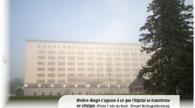
Rivière-Rouge s'oppose à ce que l'hôpital se transforme en clinique.

Après ce préambule, Rivière-Rouge demande l'engagement « ferme, officiel et à long terme de Québec d'aucunement réduire les services dispensés à l'hôpital [...] entre 20 h et 8 h, et de rejeter le Projet clinique [...] ou tout projet similaire ». Rivière-Rouge veut que le CISSSLAU et Québec « participent activement au Comité santé et qu'ils y nomment des représentants compétents » pour trouver des solutions.