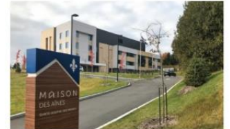
La MDA de Sainte-Agathe-des-Monts est la première à être inaugurée dans les Laurentides.