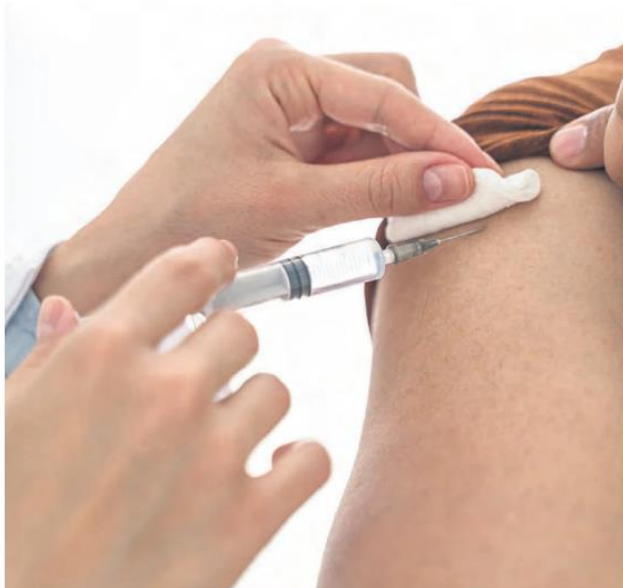
La vaccination est recommandée aux personnes à risque de développer des complications.