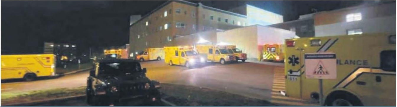
Le 11 octobre dernier a été une journée très achalandée à l'Hôpital de Saint-Eustache.

Stéphane Tremblay @stremblay@groupejcl.ca