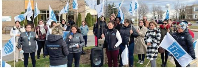
Les membres du syndicat FIQ-SPSL veulent des meilleures conditions de travail et rejettent les propositions du gouvernement.

France Poirier - Les professionnelles en soins des Laurentides seront en grève les 8 et 9 novembre prochains. La dernière grève remonte à 25 ans.