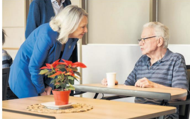
La ministre Bélanger s'adressant à un résident récemment installé à la Maison des aînés de Prévost

La ministre Sonia Bélanger présentait ainsi ladite Maison « Nous pouvons nous réjouir de savoir que plusieurs personnes d'ici, à Prévost,