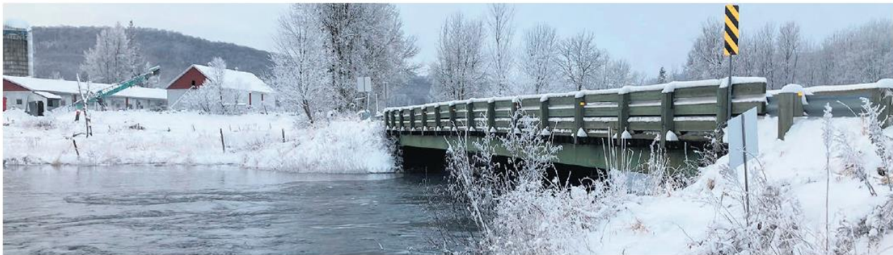
La rivière Kiamika à la hauteur de la montée Deschambault. Depuis le début de la crise, les autorités publiques tentent d'abaisser le niveau du réservoir Kiamika à raison de 7 à 8 centimètres par jour.