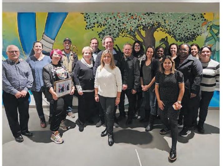
Quelques jeunes, élus municipaux et partenaires présents à ce vernissage tenu à La petite église.

Notons, enfin, qu'il est possible de plonger dans les coulisses du projet MirAge dans le cadre d'une exposition présentée à la bibliothèque Guy-Bélisle durant tout le mois de décembre. Les jeunes y expliquent, entre autres, pourquoi ils ont choisi d'intégrer les éléments que l'on retrouve dans les différentes murales.