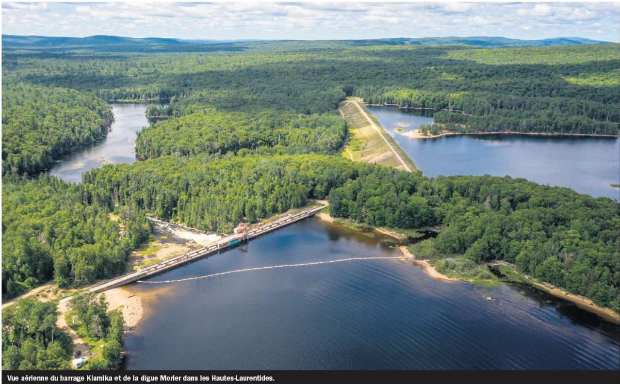
Vue aérienne du barrage Kiamika et de la digue Morier dans les Hautes-Laurentides.