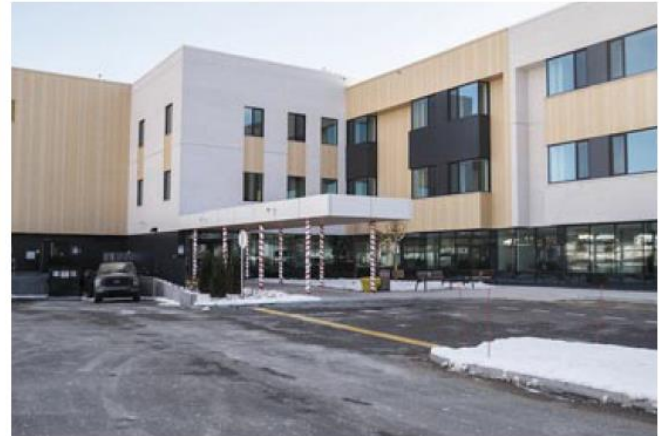
Nouvelle maison des aînés de Prévost située sur la rue Chopin.