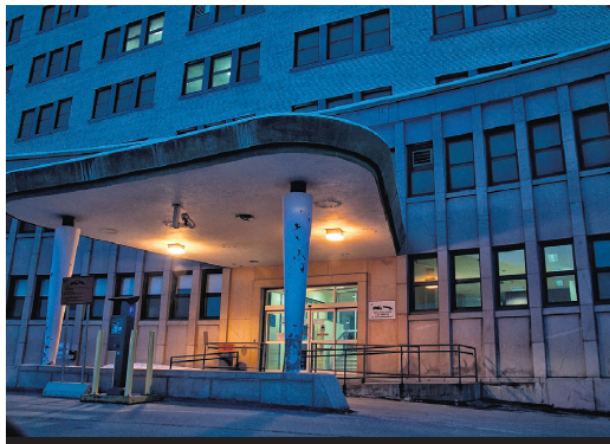
Dès le 1er février, l'urgence de Rivière-Rouge fermera ses portes entre 20 h et 8 h, et ce, 7 jours par semaine. Le manque de main-d'œuvre est cruel.

Le CISSSLAU a travaillé des mois avec des partenaires de la communauté qui ont été entendus et informés durant le processus. Il a fallu évaluer plusieurs éléments afin de prendre une décision éclairée : le nombre de visites à l'urgence et les principales périodes d'achalandage (environ 6 personnes