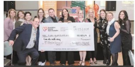
Un nouveau record en bénéfices nets dépassé

et communautaire Thérèse-De Blainville et affichait complet avec 300 convives de la communauté d'affaires des Basses-Laurentides qui ont pu bénéficier d'un cocktail, d'une chaudière du pêcheur, d'un buffet froid et d'un coin chaud, d'un repas homard et boeuf à volonté, d'une variété de sushis, de vins au souper, de desserts et du café.