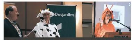
Pour souligner de façon originale cette 5 e édition

assurait encore une fois le service de traiteur de l'événement.