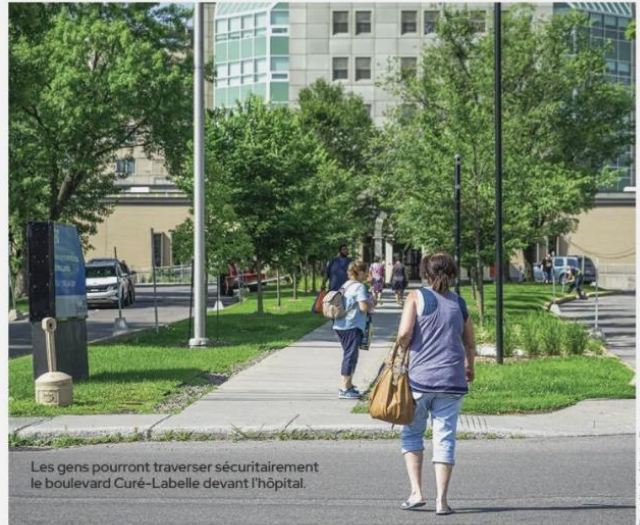
Les gens pourront traverser sécuritairement le boulevard Curé-Labelle devant l'hôpital.

Selon le conseiller Desormeaux, ce ne sera pas fait avant le printemps prochain parce qu'on doit changer un poteau sur le coin de la rue Durand. « J'aimerais que ce soit prêt pour l'automne, mais avec les travaux que ça exige, je ne crois pas que ce soit fait