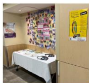
Table de documentation disponible pour tous

La vidéo est disponible : https://youtu.be/lvndpBe9wPE