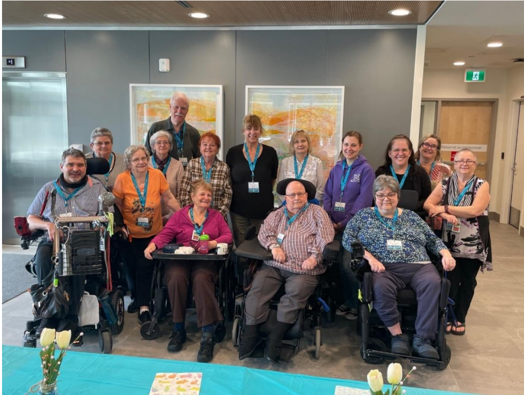
Les membres des comités présents lors du « lac-à-l'épaule » le 28 mars 2024

Des « trousse d'accueil » ont été remises afin d'outiller les nouveaux membres : ruban pour carte d'identité, cahier de notes, stylos, sac et portfolio incluant les documents importants (serment de confidentialité, code d'éthique, dépliants, informations en lien avec les comités, etc.) Ce petit cadeau de bienvenue et de remerciements a été apprécié.