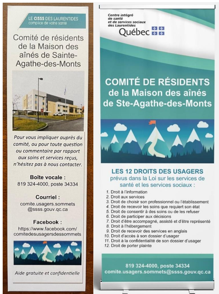
Le signet et la bannière du comité.

Le comité de résidents (CR) de la Maison des aînés (MDA) de Ste-Agathe-des-Monts a débuté ses activités en décembre 2023. Les membres du comité n'ont donc pas eu le temps nécessaire pour débiter de grands projets dans la dernière année. Toutefois, dès le départ, nous avons tenu à nous outiller afin d'afficher le comité ; la priorité initiale étant de se faire connaître des résidents et de leurs proches. Des signets ont été partagés et une bannière défilante a été installée à l'entrée de la MDA.