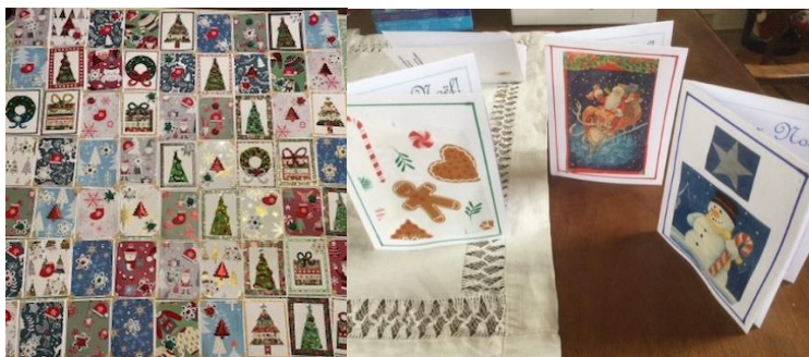
Quelques-unes des cartes bricolées.

Des cartes de Noël ont été préparées pour les résidents. Elles ont été distribuées par des employés durant le temps des Fêtes. En plus de permettre de partager nos souhaits, ce projet avait pour but de créer un lien de proximité avec les résidents et d'afficher la présence du comité dans l'établissement.