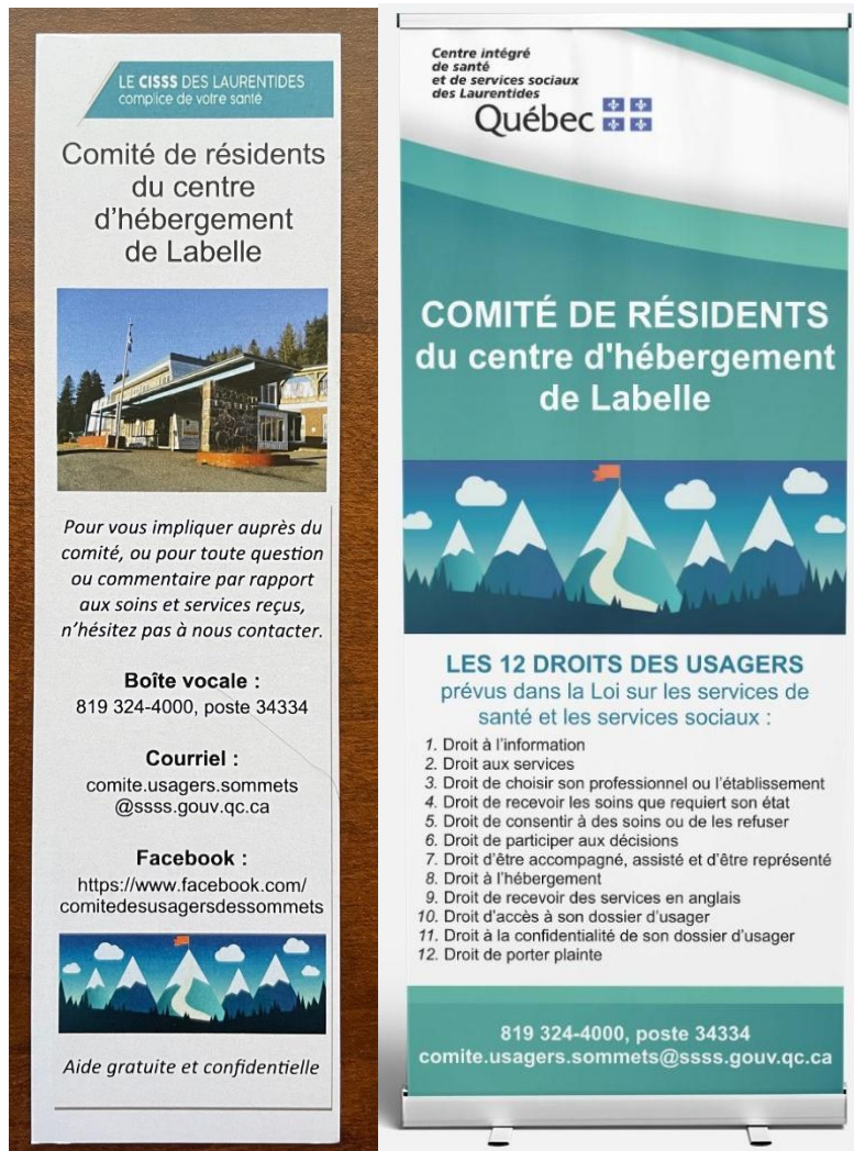
Le signet et la bannière du comité.

Le comité devait être plus visible dans l'établissement. Une bannière défilante a donc été installée à l'entrée et des signets sont disponibles pour être distribués sur place.