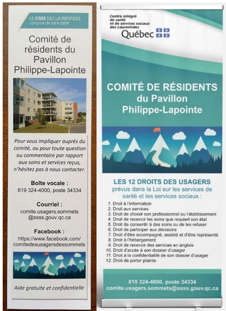
Le signet et la bannière du comité.